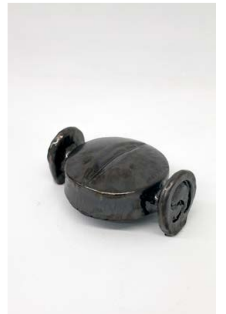
Metamorfosis - píldoras Cerámica construcción manual medidas variables