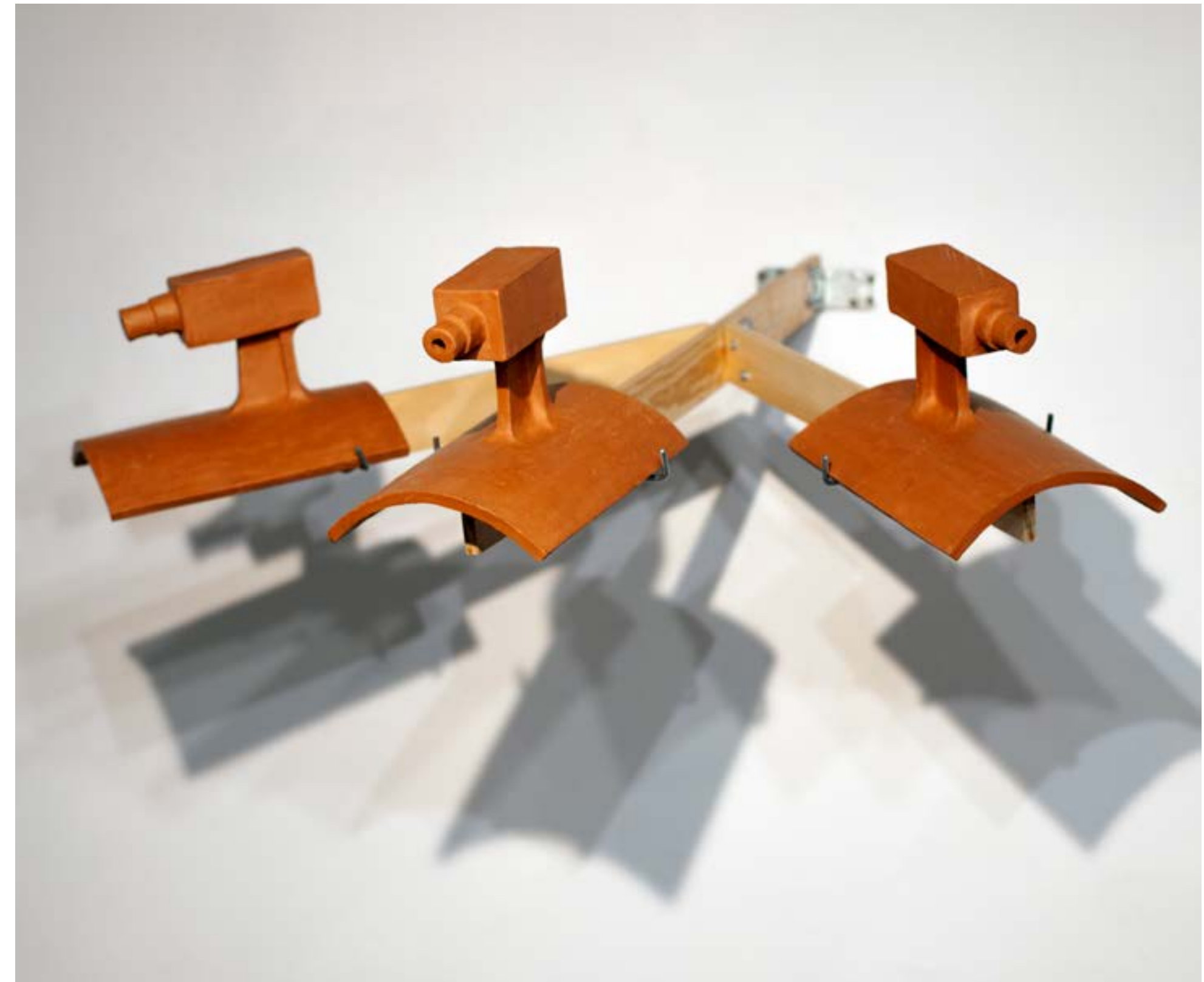
Hibridación, teja muslera y videovigilancia Cerámica terracota bruñida, construcción manual 27 x 73 x 86 cm