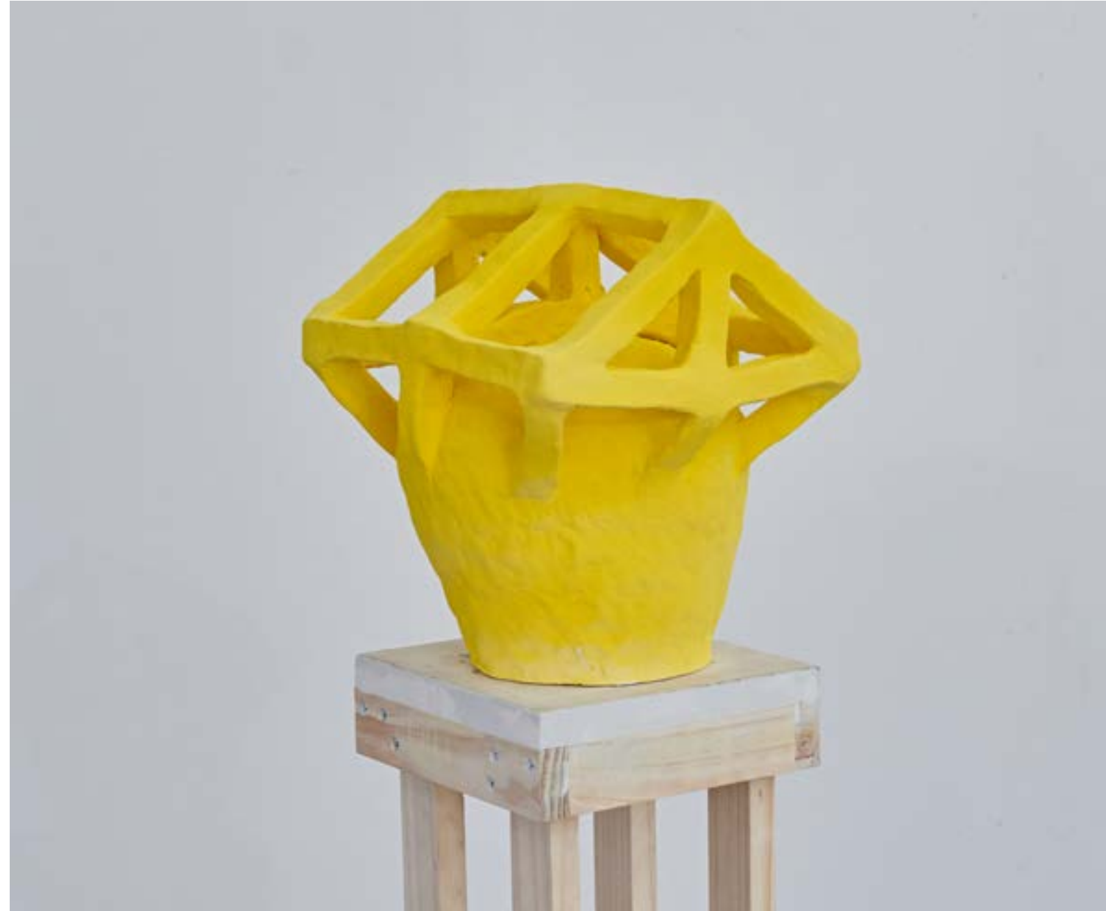
Casa Cerámica construcción manual 70x 50 x 50 cm