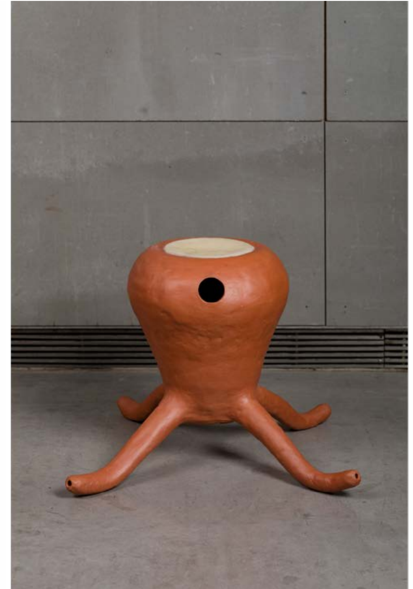
Piezas de cerámica hechas en construcción manual en terracota bruñida. Medidas variables.