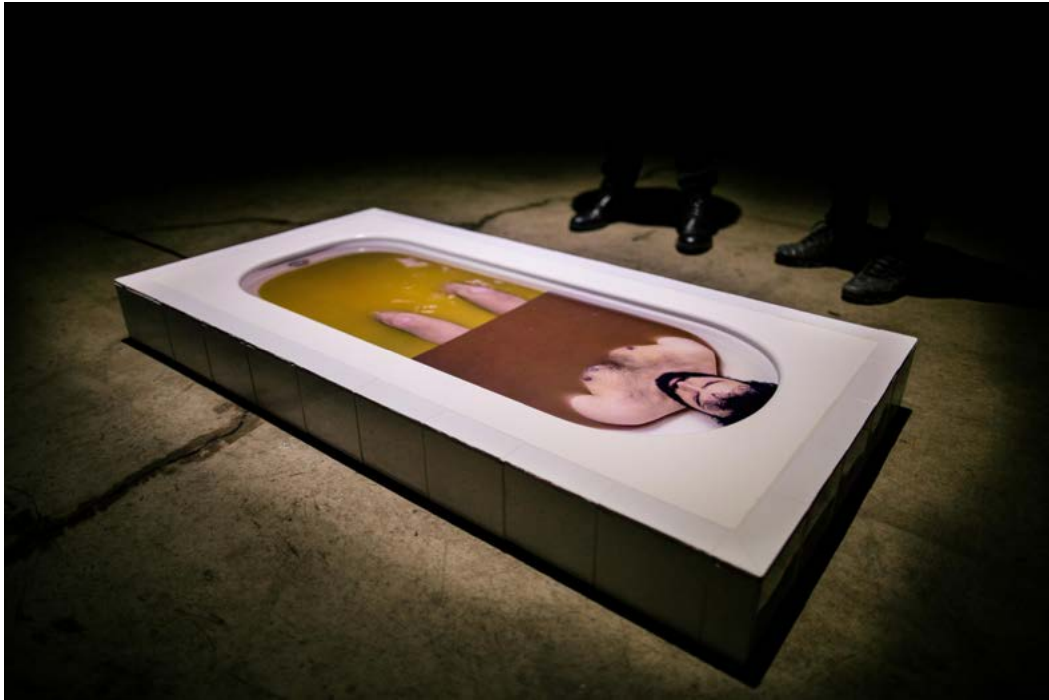
Bañera Video objeto