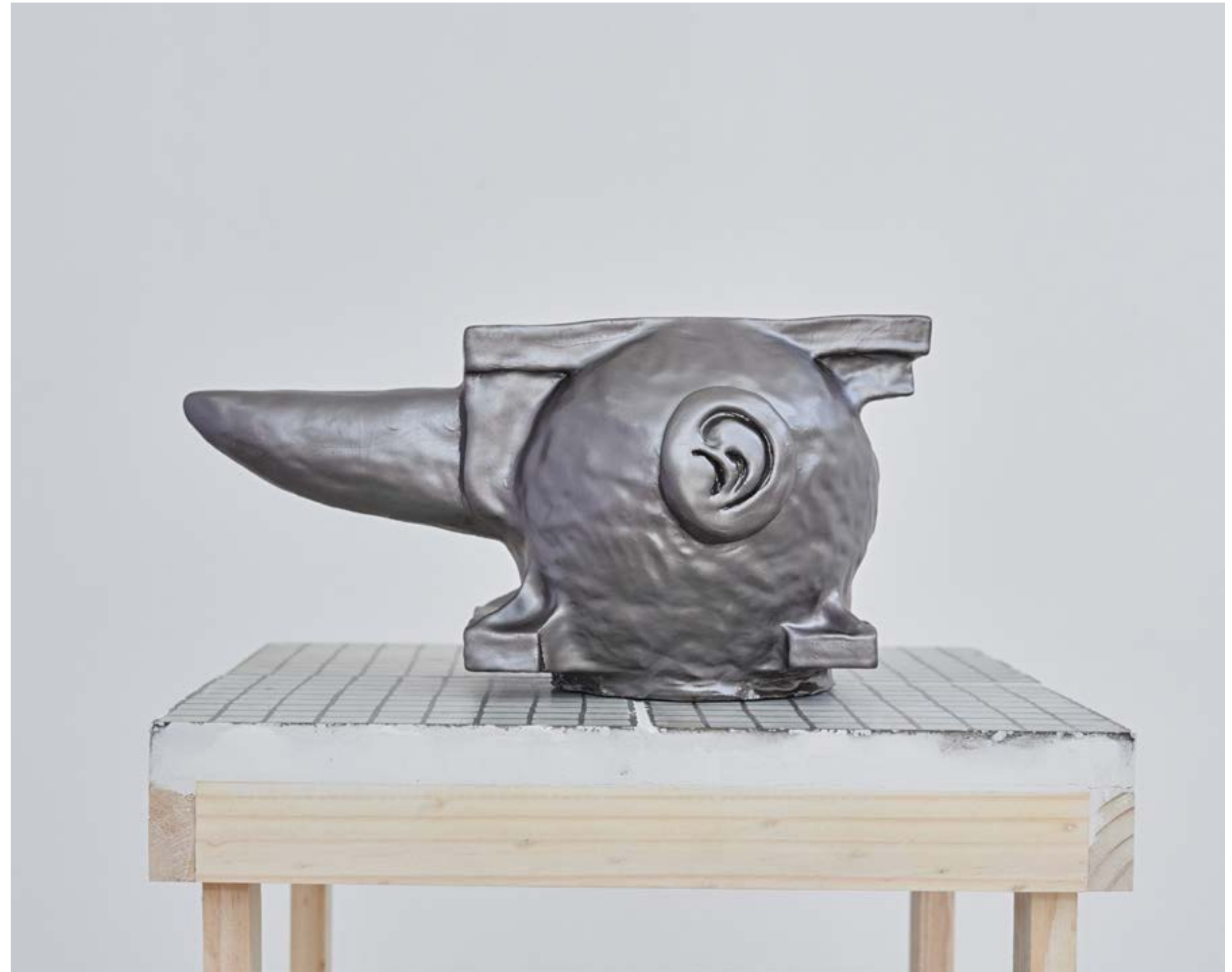
Yunque Cerámica construcción manual 60 x 30 x 34 cm.