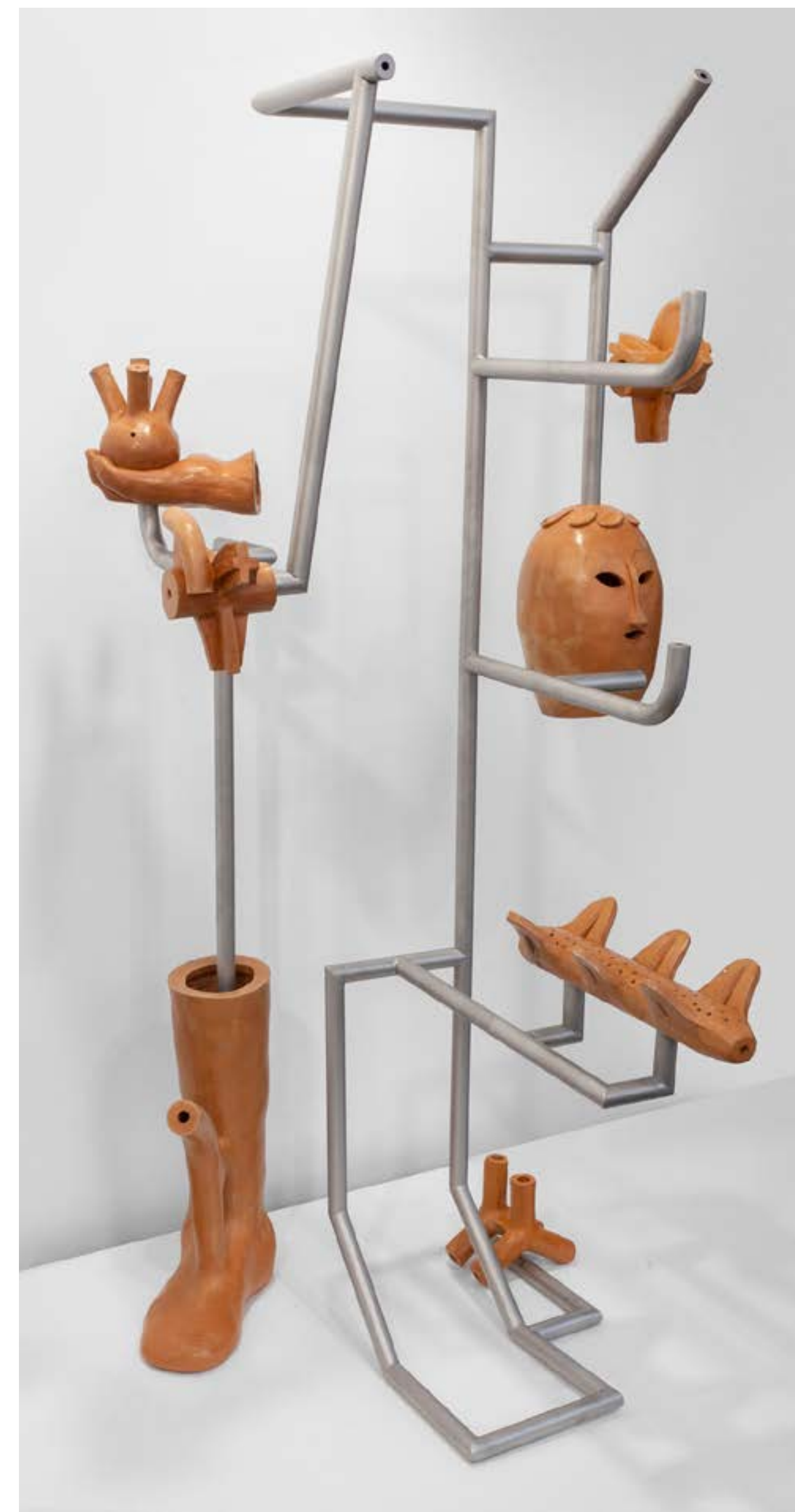
Siete piezas de cerámica hechas en construcción manual en terracota bruñida y tubo de acero de 3 cm de diámetro. 190 x 85 x 80 cm. aprox.