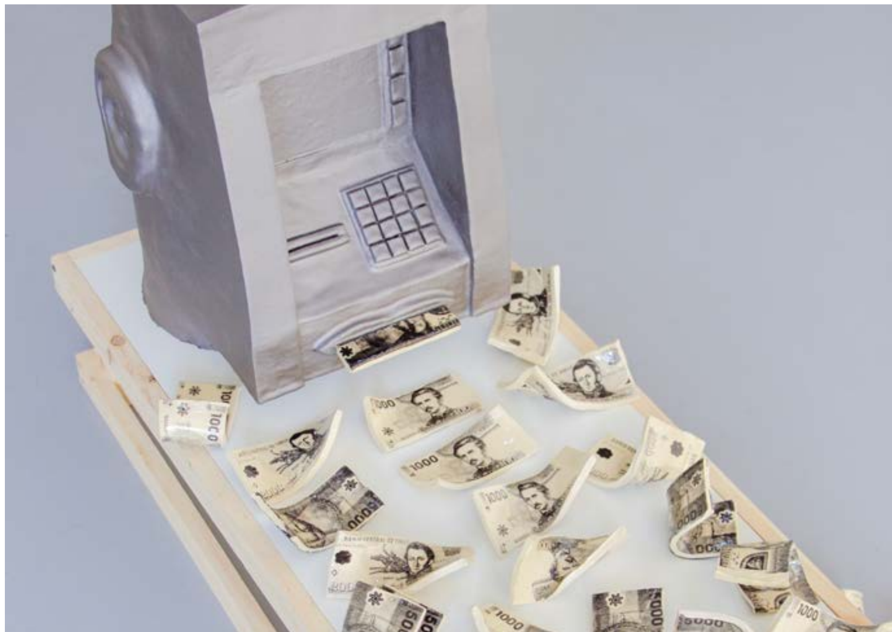
Cajero automático Cerámica construcción manual 180 x 70 x 50 cm.