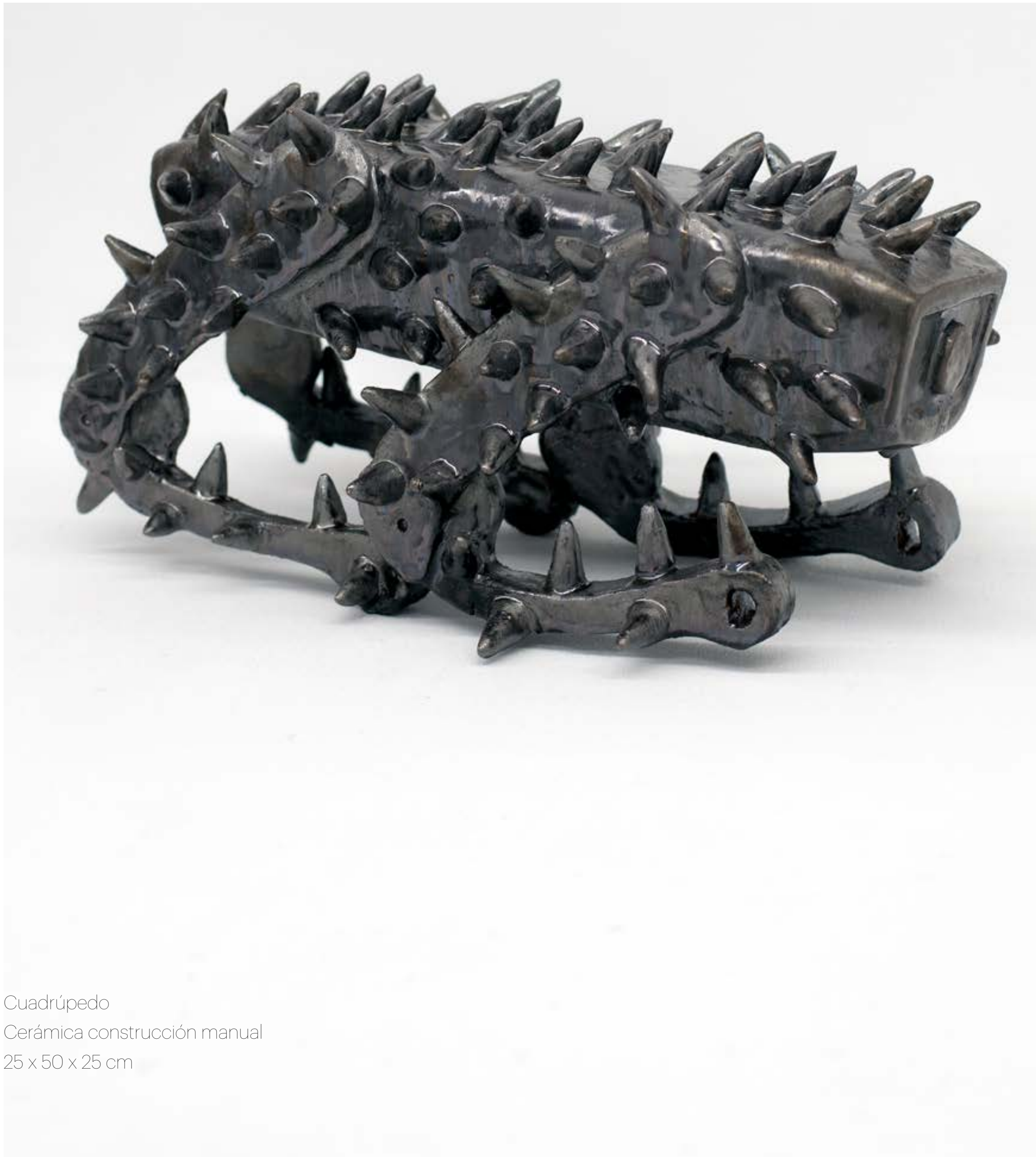
Cuadrúpedo Cerámica construcción manual 25 x 50 x 25 cm