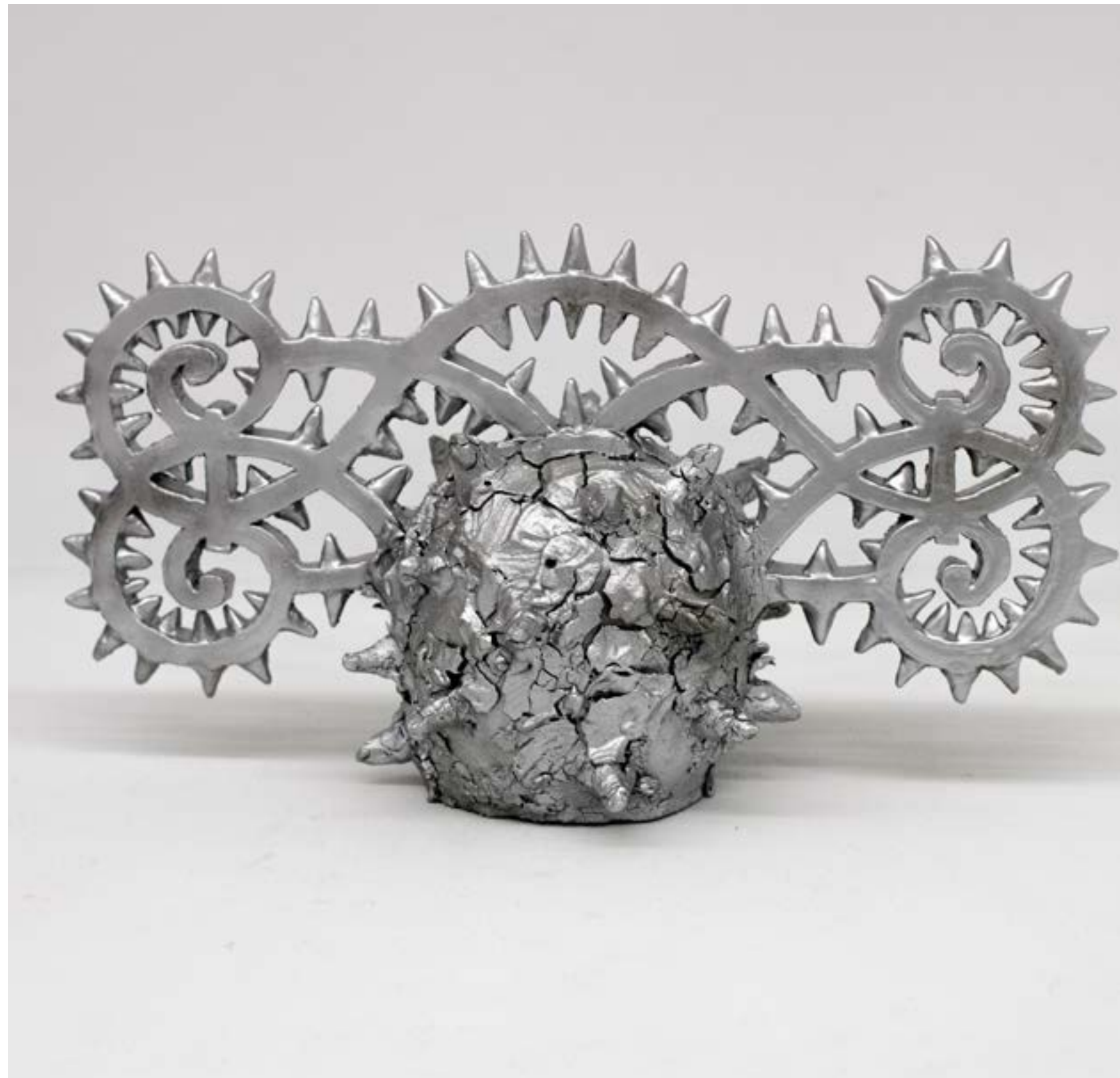
Rejas Cerámica, construcción manual 26 x 48 x 20 cm